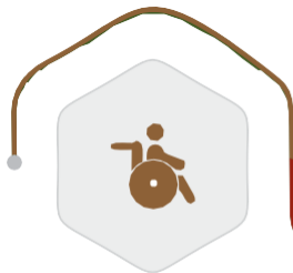
ذوي الاحتياجات الخاصة